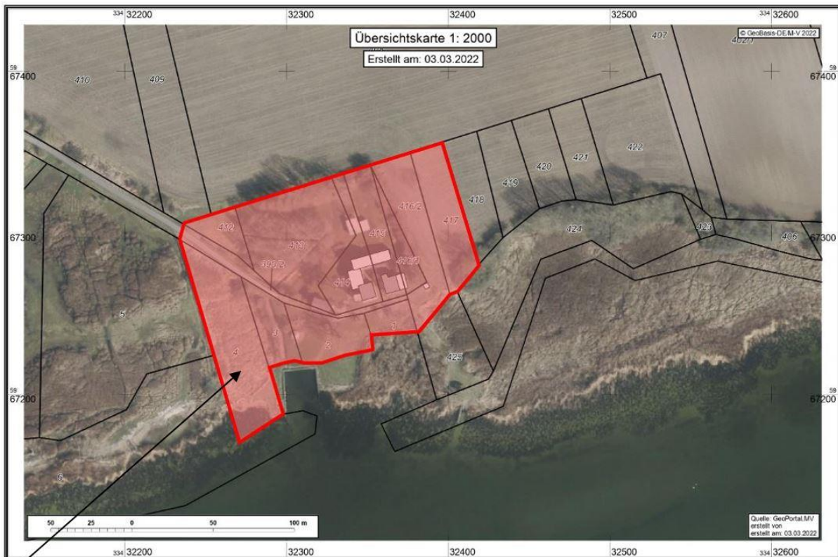
Geltungsbereich des vorhabenbezogenen Bebauungsplanes Nr. 1 "Dörfliches Wohngebiet am Haff im Ortsteil Welzin der Stadt Usedom"