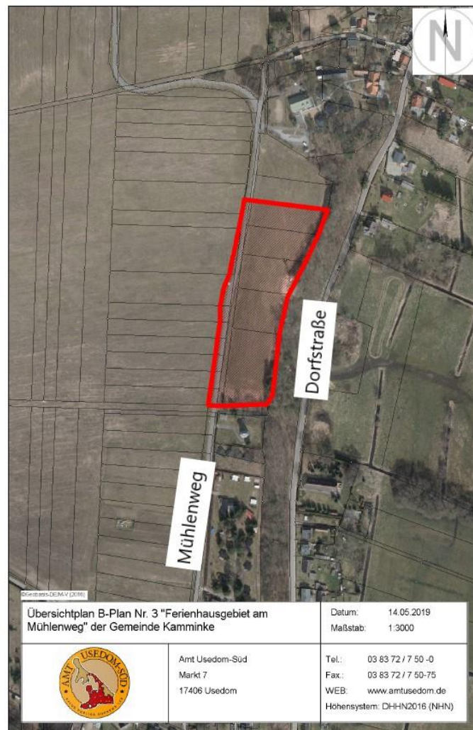
Übersichtsplan zum B-Plan Nr. 3 „Ferienhausgebiet am Mühlenweg“