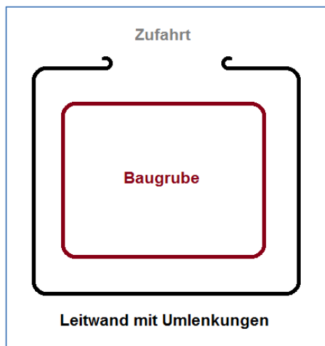
Abb. 4 Einbauzeichnung/ Prinzipiskizze