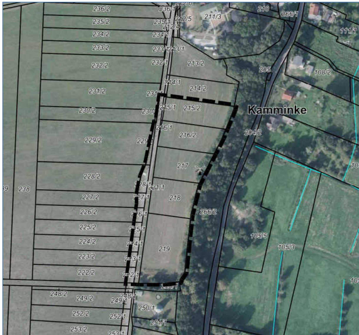
Abb. 1 Plan- und Untersuchungsgebiet

Bebauungsplan Nr. 3 "Ferienhausgebiet am Mühlenweg" der Gemeinde Kamminke