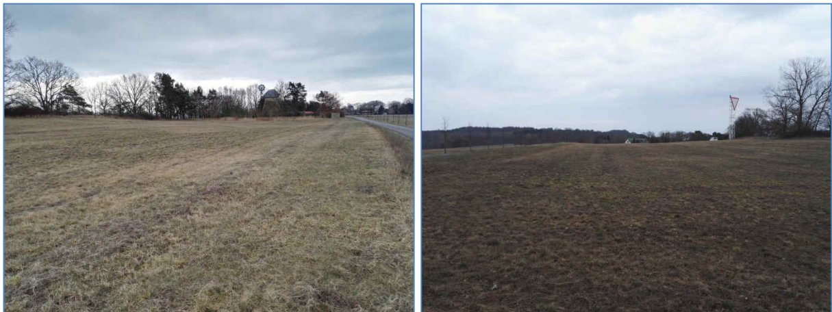
Abb. 2 und 3 Ansichten des Plangebietes

Als Planungsziele werden benannt: Schaffung der Rechtsgrundlagen für die vorgesehenen Nutzungen, Schaffung von Baurecht für die geplante Neubebauungen mit Ferienhäusern, Abrundung der vorhandenen Struktur des Ortes Kamminke und Sicherung einer städtebaulichen geordneten Entwicklung unter Berücksichtigung der Anforderungen an Naturschutz und Landschaftspflege.